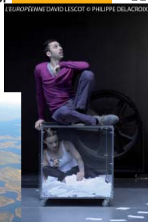
L'EUROPÉENNE DAVID LESCOT

Rencontre autour de la création de David Lescot « L'Européenne » en partenariat avec le théâtre de la Ville sur le thème « Le défi d'un théâtre polyglotte ».